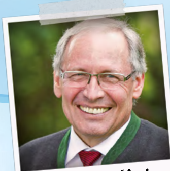
Anton Klotz Landrat Oberallgäu